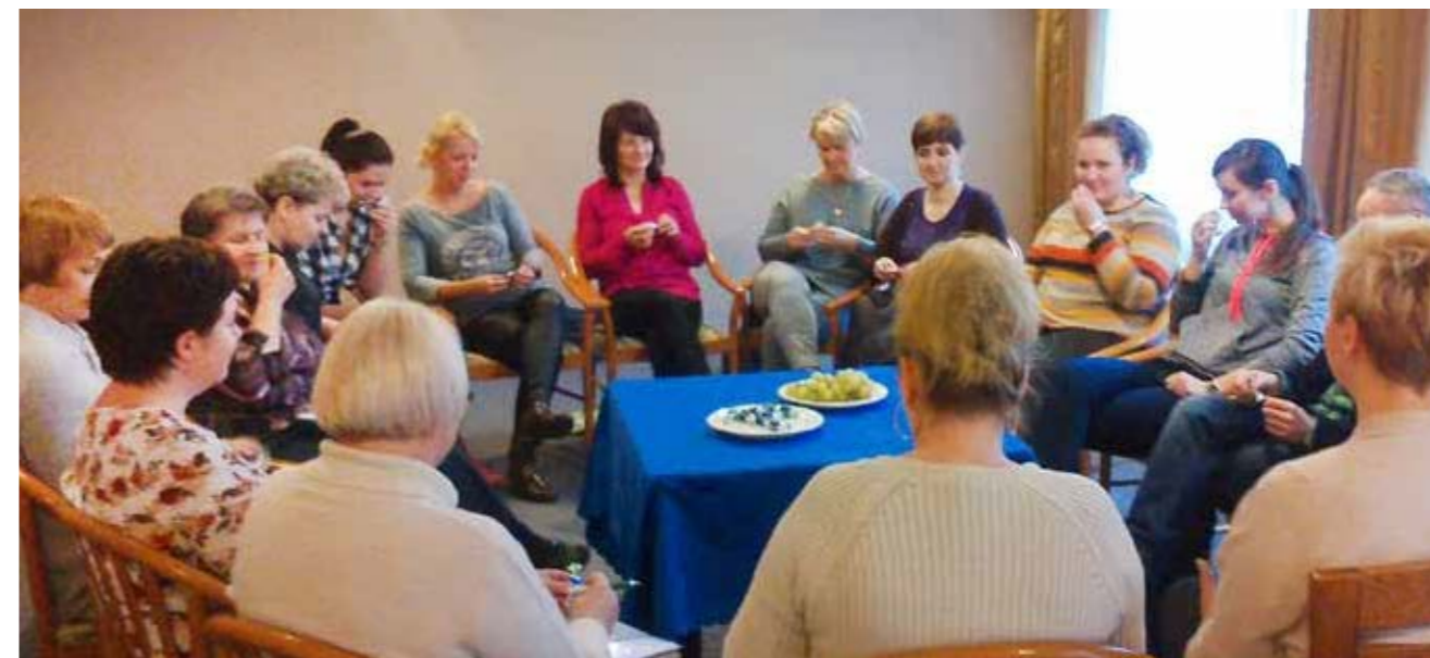
► Stres i wypalenie zawodowe

Działalność gospodarcza SIZ jest możliwa dzięki wieloletniej współpracy SIZ z różnorodnymi podmiotami publicznymi i prywatnymi, z którymi zawierane są partnerstwa czy konsorcja na potrzeby realizacji zamówienia i które