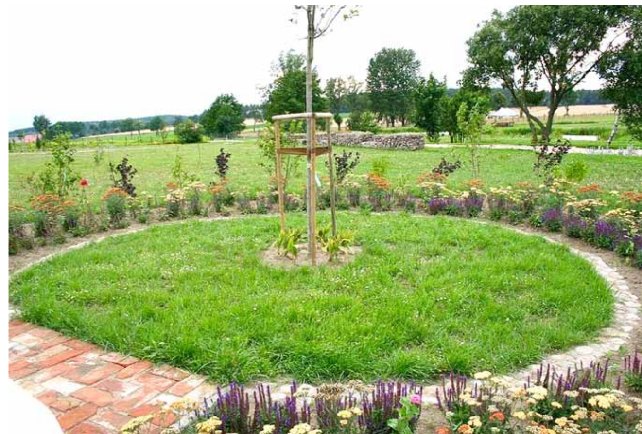
► Fragment Rajskiego Ogrodu