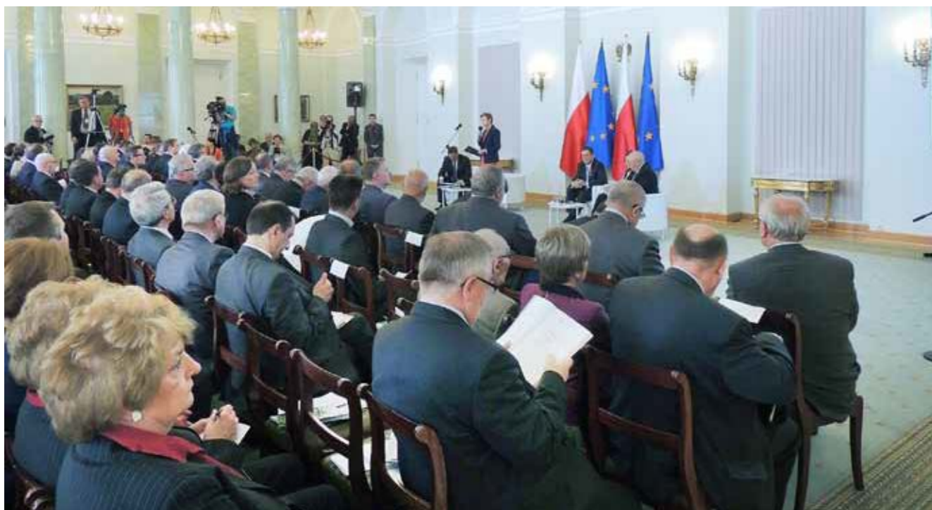
► Promocja raportu Polska wieś

01-682 Warszawa, ul. Gombrowicza 19 tel. 22 864 03 90, fax 22 864 03 61 www.facebook.com/Fundacja.FDPA www.fdpa.org.pl