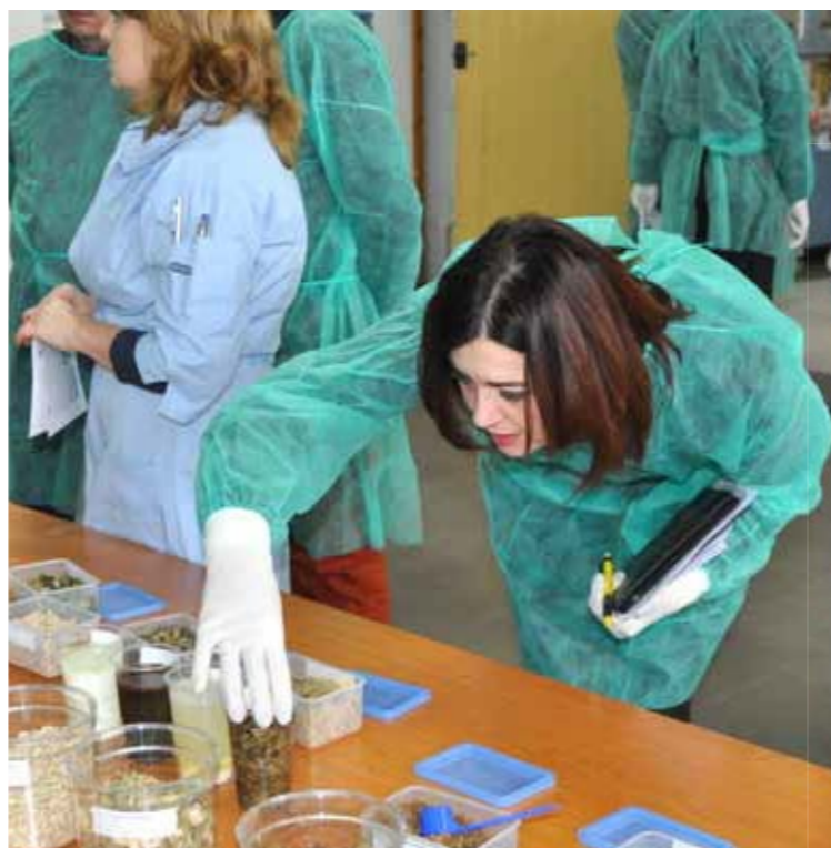
► Warsztaty_dla doradców rolnych dotyczące OZE

Więcej informacji na temat działalności Fundacji na rzecz Rozwoju Polskiego Rolnictwa znajdują Państwo na stronie internetowej www.fdpa.org.pl .