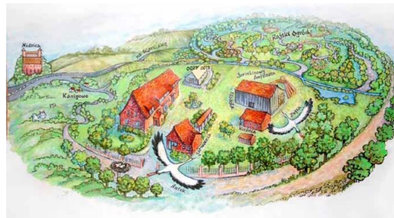
► Plan Garncarskiej Wioski

Garncarska Wioska zatrudnia kilkunastu pracowników, współpracuje z zewnętrznymi podmiotami, twórcami ludowymi. Pracownicy wioski prowadzą trzy stale działające pracownie produkcyjne: garncarską, krawiecką i papieru czerpanego. Prowadzą także warsztaty rzemieślnicze dla grup zorganizowanych bądź osób indywidualnych. Przedsiębiorstwo organizuje konferencje, szkolenia, jarmarki. Uczestni-