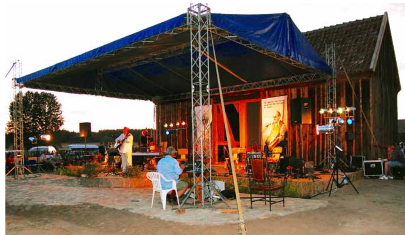
► I Festiwal Bułata Okudźawy w Garncarskiej Wiosce