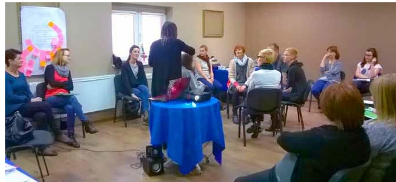
► Terapia zajęciowa dla dzieci z zaburzeniami zachowania

W prowadzeniu działalności gospodarczej pomaga długi okres funkcjonowania Stowarzyszenia Instytut Zachodni, transparentność działań, zaangażowanie zespołu w realizację powierzonych zadań i pozwala to na oferowanie klientowi najwyższej jakości usług.