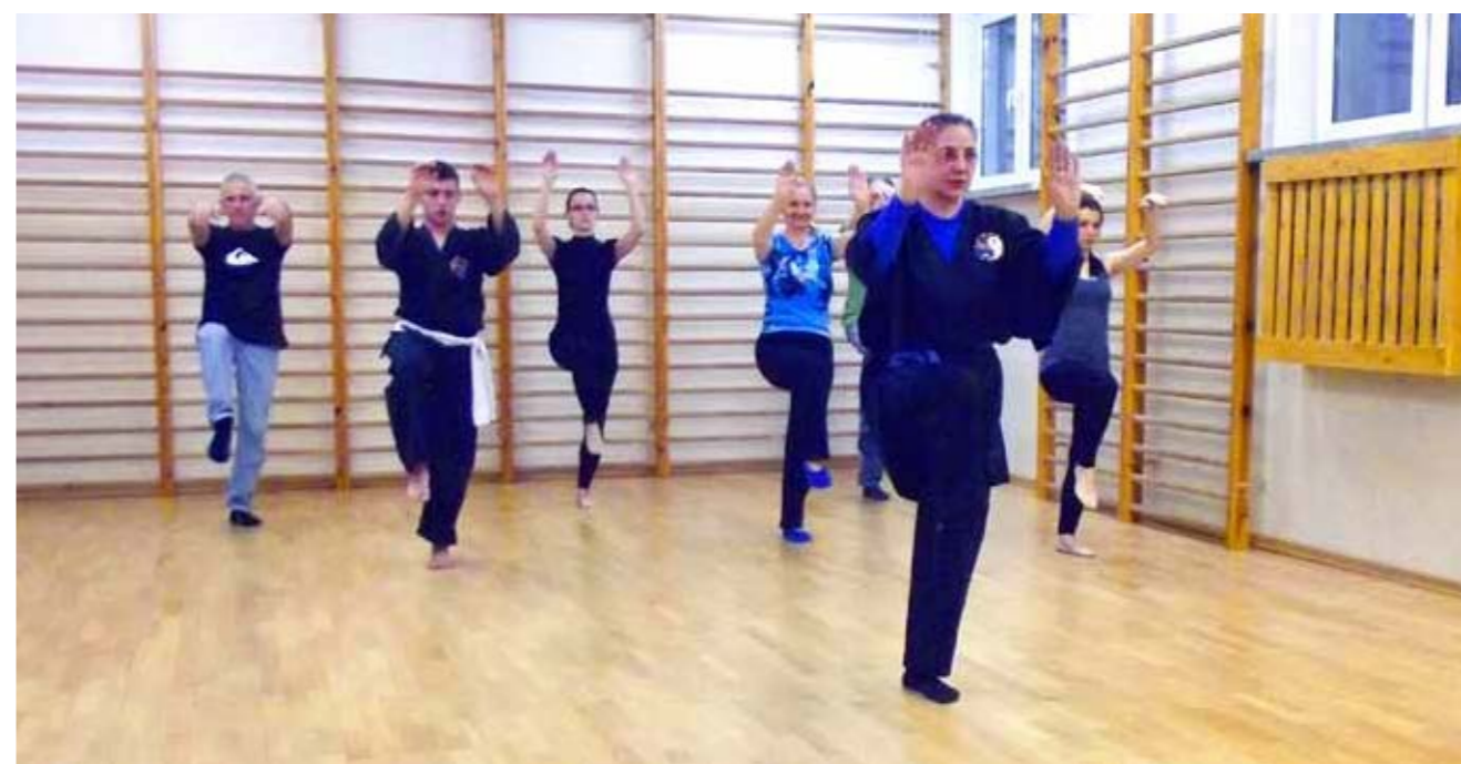
► Zajęcia otwarte w Szkole Policealnej – Elk

Informacja dotycząca realizacji zajęć została zamieszczona w prasie w formie reklamy. Stowarzyszenie dociera także do klientów i potencjalnych klientów poprzez Facebooka oraz kontakty bezpośrednie, rekomendacje obecnych uczestników zajęć. Prowadzi także zajęcia otwarte, pokazowe wśród różnych grup, aby rozpropagować formę Viet Tai Chi (między innymi podczas wydarzeń otwartych, plenerowych).