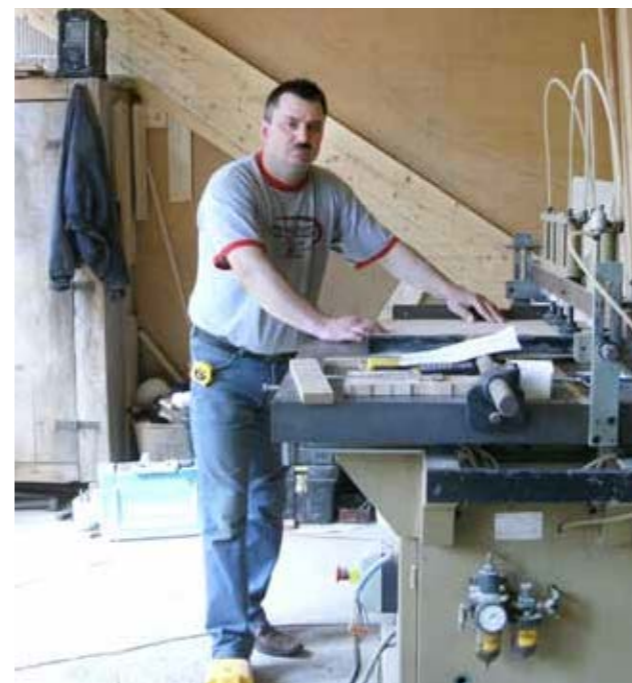
► Oferta FDPA jest skierowana w szczególności do mikro, małych i średnich firm, w tym również do takich, które dopiero rozpoczęły swoją działalność

Fundusz Pożyczkowy FDPA jest częścią Krajowego Systemu Usług dla Małych i Średnich Przedsiębiorstw, a jego misją jest działalność na rzecz poprawy dostępu przedsiębiorstw do finansowania zewnętrznego. Oferta jest skierowana w szczególności do mikro, małych i średnich firm, w tym również do takich, które dopiero rozpoczęły swoją działalność i z powodu braku historii kredytowej lub zabezpieczeń mają trudności w zdobyciu finansowania komercyjnego. Doceniamy zapał młodych przedsiębiorców, którzy nie mają jeszcze wyników w postaci księgowego dochodu, ale za to mają wizjonerski pomysł i racjonalny, przemyślany plan jego wdro-