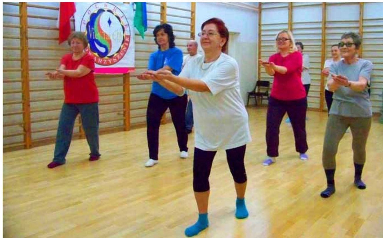
► Warsztaty Viet Tai Chi podczas „Spotkania z Kulturą Wietnamu – 2013”