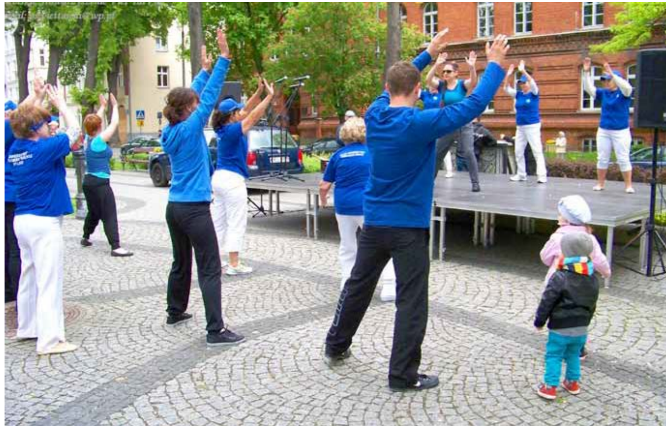
► Pokaz podczas Elckiej Majówki – 2014