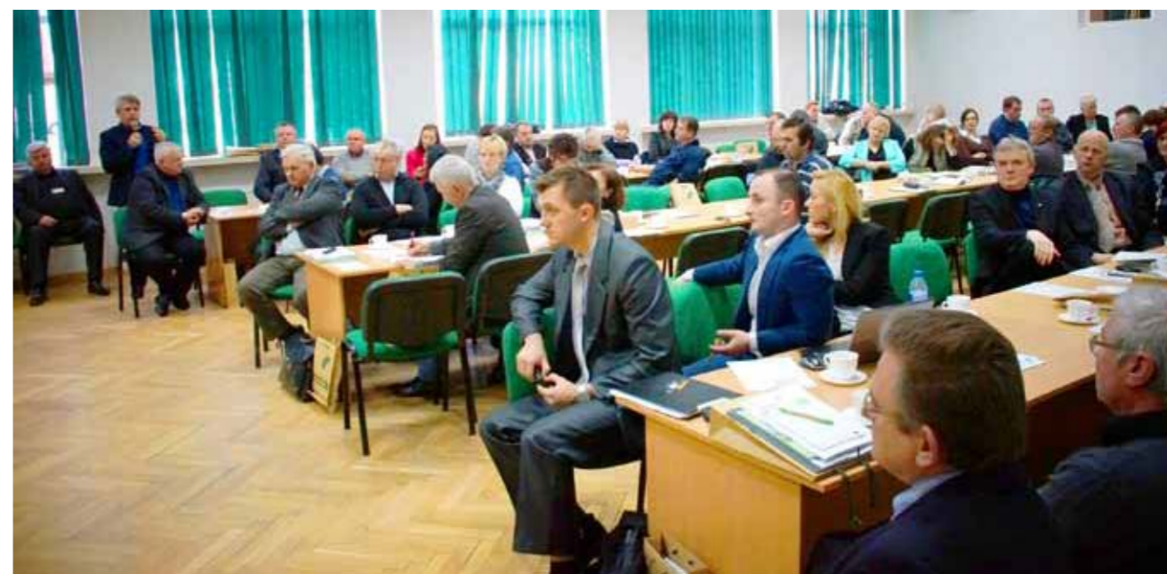
► Konferencja regionalna dla doradców rolnych dotycząca tematyki OZE

żenia. Działamy w regionach, w sąsiedztwie naszych klientów, dlatego też posiadamy dobre rozeznanie rynku. Znamy problemy przedsiębiorców, dzięki czemu możemy być elastyczni i szybko reagować na ich potrzeby.