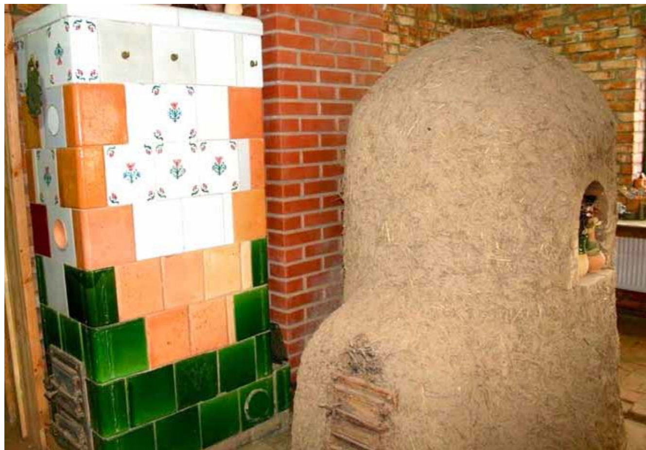
► Pracownia garncarska

Do przygotowania opisu korzystano z materiałów dostępnych na stronach: www.nida.pl , www.rajski.ogrod.org.pl , www.pelplin.pl/z-wizyta-w-garncarskiej-wiosce