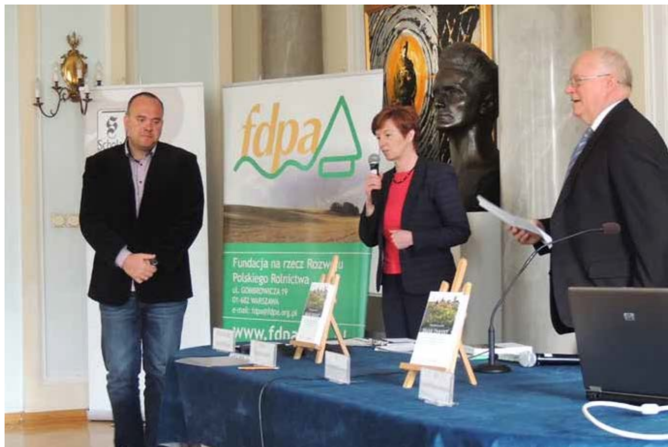
► Laureat konkursu Polska wieś – dziedzictwo i Przyszłość podczas promocji publikacji